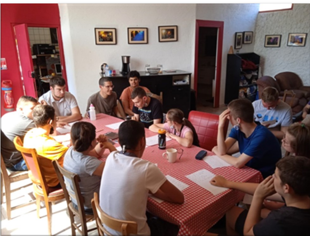
Séance d'écriture des textes.

Un projet Slam : on a appris à travailler sur les mots pour faire des chansons – C'était trop bien.